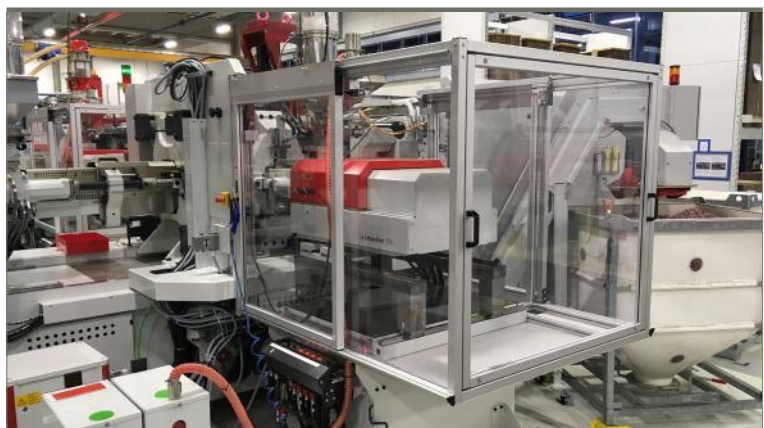
Produktionsanlage; Foto: © ifu GmbH